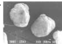
Abb. 3. Rundes Korn (vgl. AKW, 2003).

Für den Sportboden „Sand“ werden gerundete bis kugelförmige Körner empfohlen (vgl. Breuer, 1998, S. 28; BISp, 2001, S. 31).