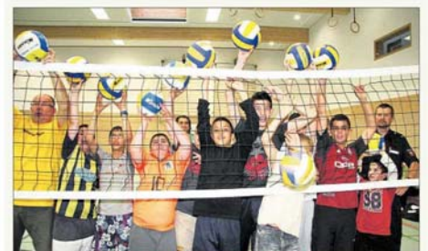
Bälle fliegen zu später Stunde

So werden unter anderem eine Eltern-Kind-Sportgruppe sowie eine Kinder(ball)sportgruppe in der Mehrzweckhalle angeboten. Auch zeigte die DJK Kolping Northeim im Rahmen des Mitternachtssport und der Ferienpassaktion die vielfältigen Facetten des (Beach-)volleyballsports und lud alle interessierten Kinder und Jugendlichen zum unverbindlichen Ausprobieren und Mitmachen ein. Das