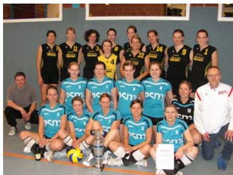
NVV-Pokal Sieger SC Spelle-Venhaus (vorne), MTV Gifhorn (hinten)

Die Endrunde fand am 7.12. in Lauenau statt.